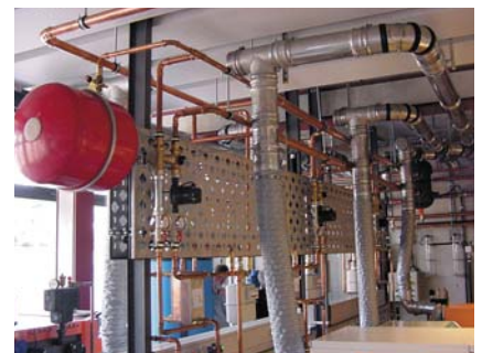
OSZ VT Heizungslabor mit Montagewand