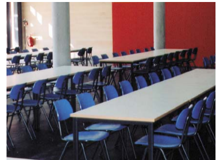
OSZ WSV Cafeteria