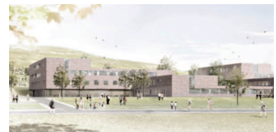
1. Preis Hascher Jehle Architektur

nicht offener Realisierungswettbewerb 2012 10 Teilnehmende NF Neubau 6000 m 2 78 Betten, 15 Plätze Tagesklinik