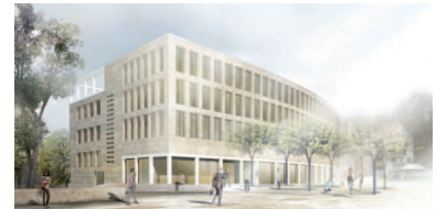
1. Preis Ackermann+Raff Architekten

nicht offener Realisierungswettbewerb 2012/2013 25 Teilnehmende BGF Bestand 4.900 m 2 BGF Erweiterung 2.500 m 2