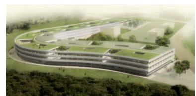
1. Preis Allmann Sattler Wappner Architekten

nicht offener Realisierungswettbewerb 2011 30 Teilnehmende PF Schulen 17.000 m 2 Sporthalle 2.800 m 2